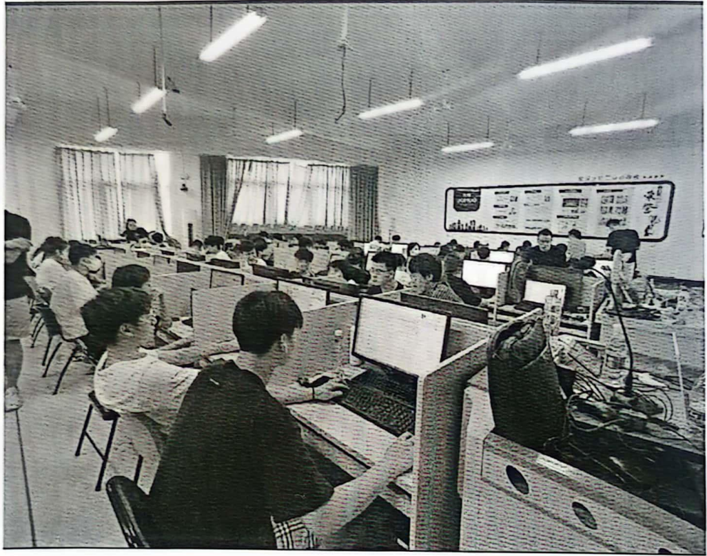
图 2: 学生顶岗实践场景图