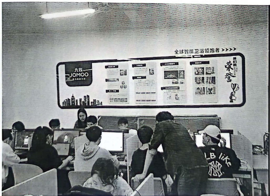
图 3: 专业教师耐心指导学生实训